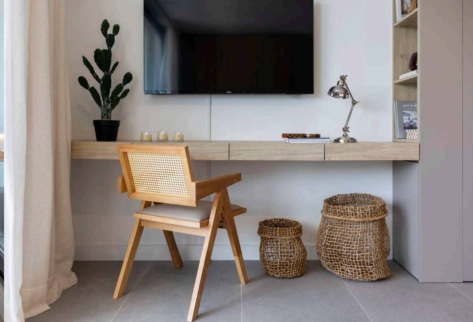
| La curaduría de muebles y objetos de decoración vuelve más disfrutable cada espacio.

otros dos que tienen dentro una tira de luz led y cumplen el doble rol de mesa de luz y espacio de decoración, aportando mucha calidez al ingresar al monoambiente. Este mueble tiene gran espacio de guardado, ya que, aparte de esconder la cama, contiene zapateras extraíbles, pantalonera y estantes con buena capacidad. Para diferenciar este sitio, se opta por hacer en el mismo mueble el frente ranurado en un material idéntico. De esa forma al verlo cerrado, solo se perciben las ranuras del módulo donde se esconde la cama. En los laterales se incluyen dos torres con estantes internos y cerradura con llave para poder guardar seguras algunas pertenencias.