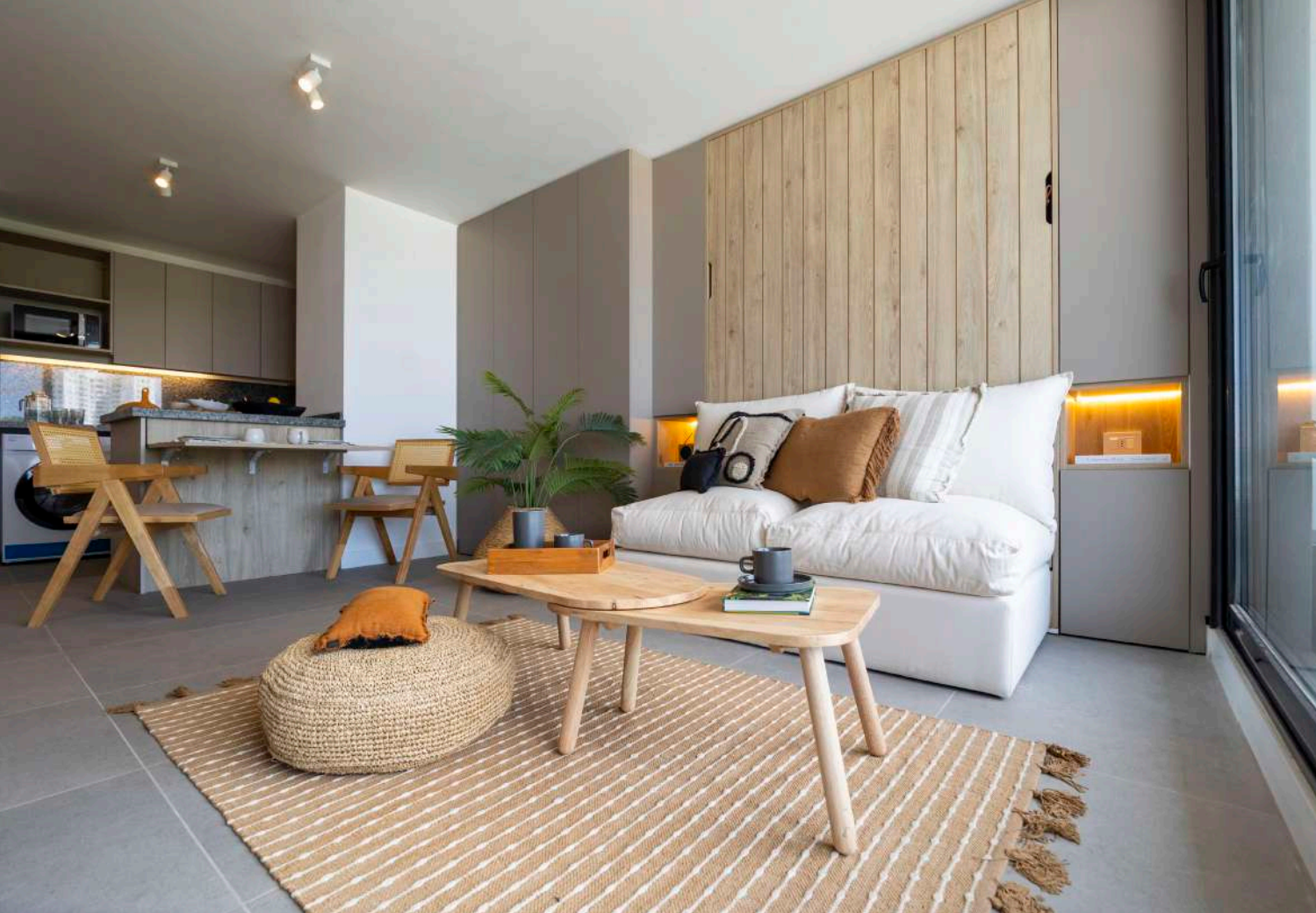
| Durante el día, con la cama abatible cerrada, el living genera armonía y amplitud.